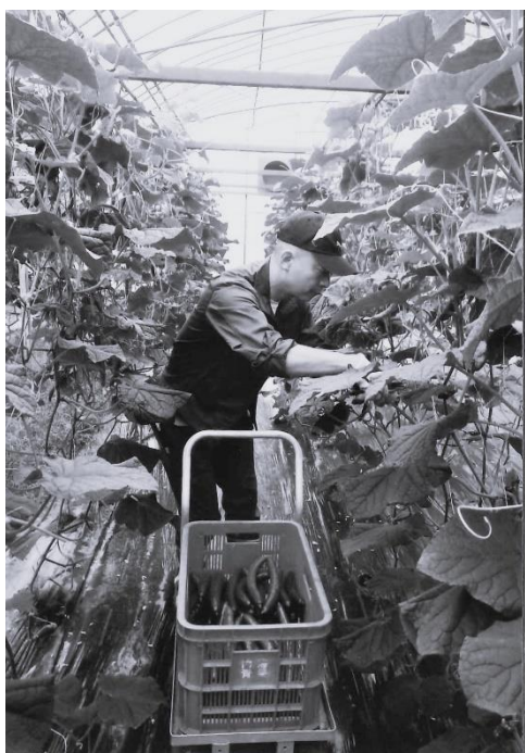
農業短期研修 (野菜栽培：津市)