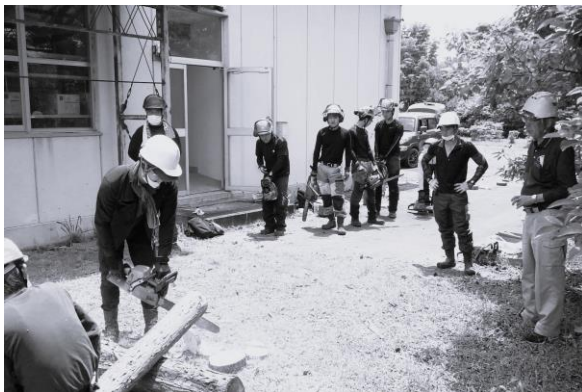
集合研修（支援センター）