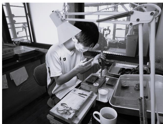
漁業短期研修（真珠養殖：志摩市）