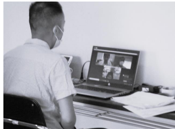
オンラインブース