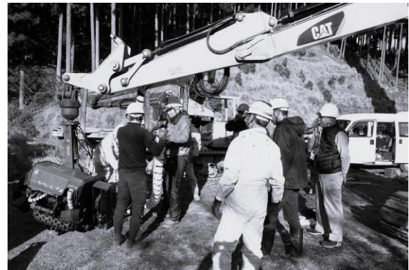
集合研修（津市白山町）