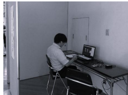
オンラインブース