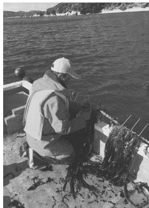
漁業短期研修（わかめ養殖：鳥羽市）