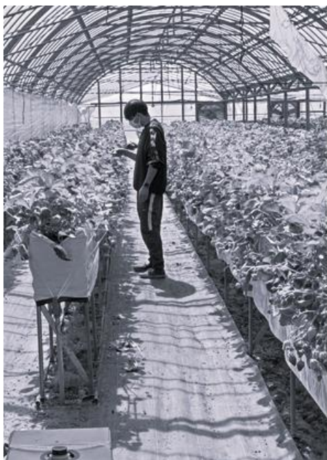
農業短期研修（野菜栽培：松阪市）